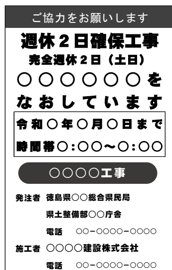
(標示板記載例) 完全週休 2 日 (土日) の場合

週休 2 日確保工事等実施要領 徳島県 HP https://www.pref.tokushima.lg.jp/jigyoshanokata/kendozukuri/kensetsu/5016115/